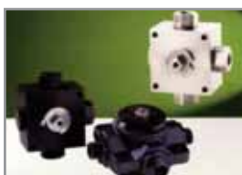
Mehrwege-Kugelhahn 3- und 4-Wege