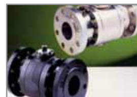
Flansch-Kugelhahn 3-teilig FKH