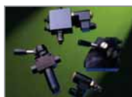
2/2 Elektromagnetventile Serie 090/091/092/093