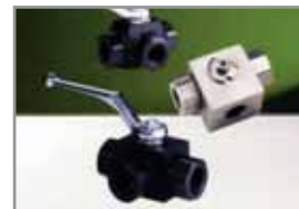
3-Wege Kugelhahn in Block (BK 3) in Schmiedeform (SK 3)