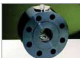
Flansch-Kugelhahn DIN/-SAE/-ISO FCKH