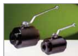
Hochdruck-Kugelhähne HRKH (800 bar)