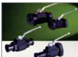
SAE-Flansch-Kugelhähne 3000 / 6000 psi