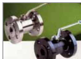
Flansch-Kugelhahn FSKH/FRKH DIN und ANSI