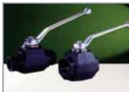
2-Wege- Schmiedestahlhahn SKH