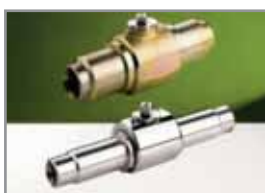
Kugelhahn mit anschweißenden ASKH/ARKH