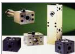
SAE-Plattenventile PV 2 / PV 3 3000 / 6000 psi