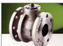
Flansch-Kugelhahn 2-teilig FKH