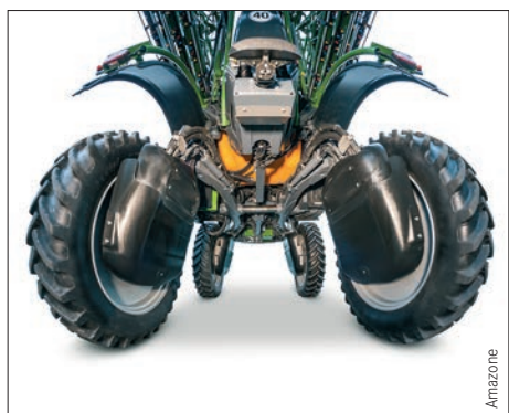
Amzone verbindet beim Fahrwerk für die selbstfahrende Feldspritze Pantera 4502 Hydraulik mit elektronischer Regelung.

gestellten Hydraulikverteilerblock. Er ist für den Prototyp einer neuen Feldhäckslerserie bestimmt. „Die Aufgabe bestand darin, den Verteilerblock bei gleichen Leistungsparametern in kleineren Ausmaßen herzustellen, um Platz für die Anschlüsse im vorgesehenen Einbauraum zu schaffen“, beschreibt Wagener die Vorgaben des auftraggebenden Landmaschinenherstellers.