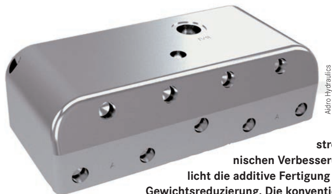
Neben strömungstechnischen Verbesserungen ermöglicht die additive Fertigung eine deutliche Gewichtsreduzierung. Die konventionell gefertigte Hydraulikkomponente (links) wiegt 5 kg, das Bauteil mit gleicher Funktion aus dem 3D-Drucker nur 1,3 kg.

Tatsächlich ist die Komponente im Vergleich zur konventionellen Fertigung nun deutlich kleiner und leichter. Nach Aussage von Valeria Tirelli, CEO bei Aidro, in der DLG Future-Lounge auf der Agritechnica, lassen